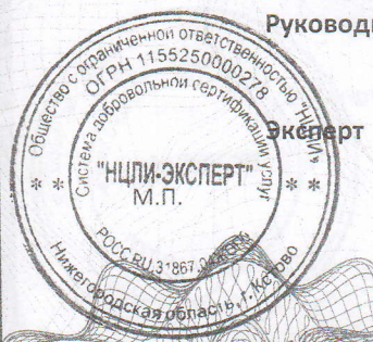
Схема сертификации 4

Акта оценки предприятия и оценки оказания услуг №3 от 30.07.2018г., Протокола проверки результата услуг №3 от 30.07.2018г., Экспертного заключения и протоколов №4/18 от 23.07.2018г., выданных ООО «НЦЛИ»